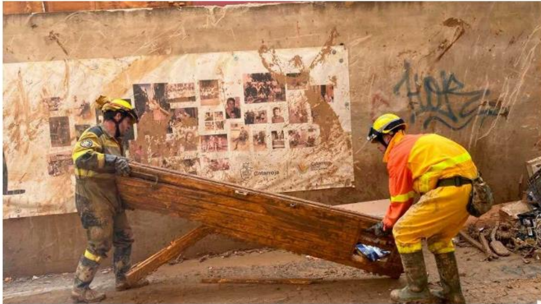
Efectivos de Sarga e Infoar colaboran para retirar una puerta de una calle de Catarroja

La organización ha adoptado el modelo europeo de excelencia empresarial EFQM, que evalúa aspectos como la estrategia, el liderazgo o la sostenibilidad